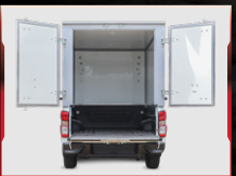
ខាងក្នុង