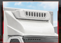
ម៉ាស៊ីនត្រជាក់ខាងក្រៅ