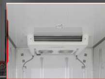
ម៉ាស៊ីនត្រជាក់ខាងក្រោម