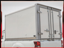
ឈូបក្រោយ